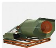
کراشر چند منظوره

دستگاه در ۱ دستگاه ۲ مناسب برای تولید خاک اره از انواع چوب دارای دو ورودی مجزا Gravity سیستم تغذیه سیستم آسیاب تلفیقی قابلیت خوراک دهی تا قطر ۱۰ سانتی متر خروجی یکنواخت